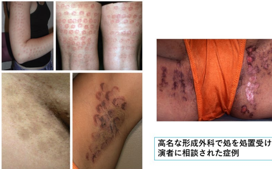
高名な形成外科で処を処置を受けた患者が演者に相談された症例

Ibrahimi OA et al. Laser Hair Removal. Dermatol Ther 2011;24:94-107