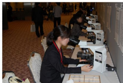
受付向いに設定されたCPC標本と顕微鏡

教育については、卒前教育、卒後臨床教育、専門医教育、そして皮膚科医によるプライマリケアにおける課題がありますが、これらは、学術大会を通して追求されるべき内容でもあります。中でも、皮膚科医が他科と関わり、さらにはこれまでの皮膚科の守備範囲を超えて活躍する場を広げていくべく、シンポジウム 2「チーム医療の将来と皮膚科医の役割」を設定し、関西医科大学医学教育センターの河本慶子先生に「卒後研修における皮膚科医の役割」について講演いただきました。河本先生は、皮膚科医として専門医の認定を受けた後スタンフォード大学で医学教育について学び、現在我が国の臨床教育指導者育成のためにご活躍中です。また、皮膚病理は、皮膚科医にとって極めて重要な診療技能ですので、一部の志高い人々のみの専門領域とならないよう、総合受付の向かい側に標本を配置し、参加者がより気軽に標本を観察できるように工夫しました。